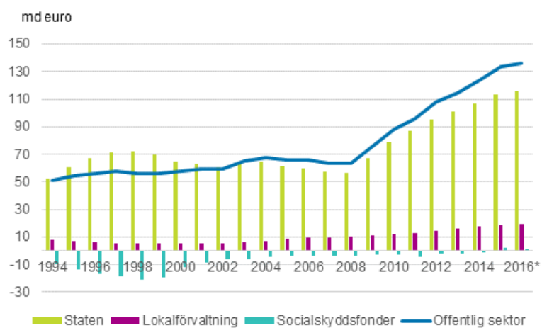
Figurbilaga 1. Bidraget av den offentliga sektorns undersektorer till den offentliga sektorns skuld, md euro 1994–2016