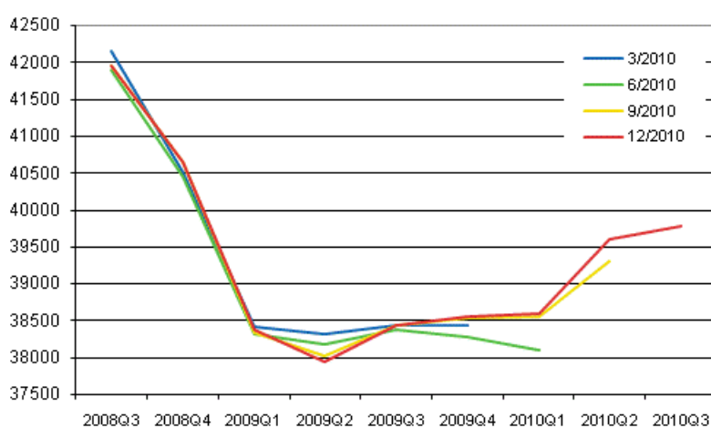
Figur 1. Revidering av den säsongrensade volymen av bruttonationalprodukten i kvartalsräkenskapernas publikationer

Också de övriga europeiska ekonomierna håller så småningom på att återhämta sig från recessionen. Enligt Eurostats preliminära uppgifter ökade bruttonationalprodukten inom EU-27-området med 0,5 procent under årets tredje kvartal jämfört med föregående kvartal.