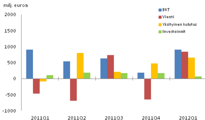
Kuvio 2. Bruttokansantuotteen ja kysyntäerien muutokset edellisestä neljänneksestä (kausitasoitettu, käyvin hinnoin)

Viennin volyymi kasvoi tammi-maaliskuussa 3,7 prosenttia edellisestä neljänneksestä, mutta oli 0,2 prosenttia pienempi kuin vuosi sitten. Tavaroiden vienti kasvoi 8,5 prosenttia edellisestä neljänneksestä, mutta palveluiden vienti väheni 9,7 prosenttia.